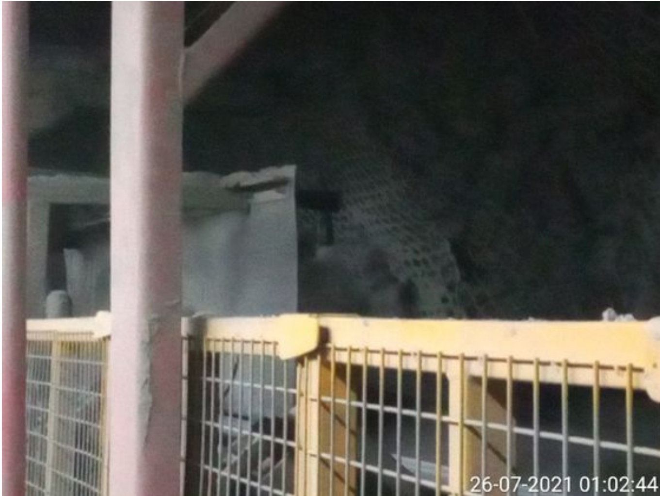
Foto 17: Medida: Regaderas. Lugar: TP1. Comentarios: Regaderas TP1 operativas.