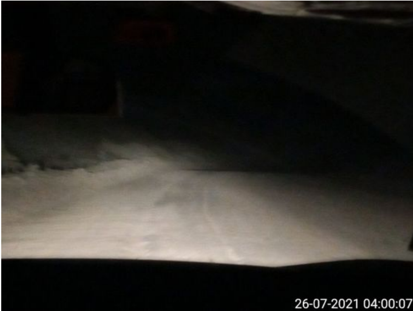
Foto 9: Medida: Riego de caminos EPSA Cerro Amarillo. Lugar: Fases superiores. Comentarios: Sin circuito por colación. 1 EPSA operativo.