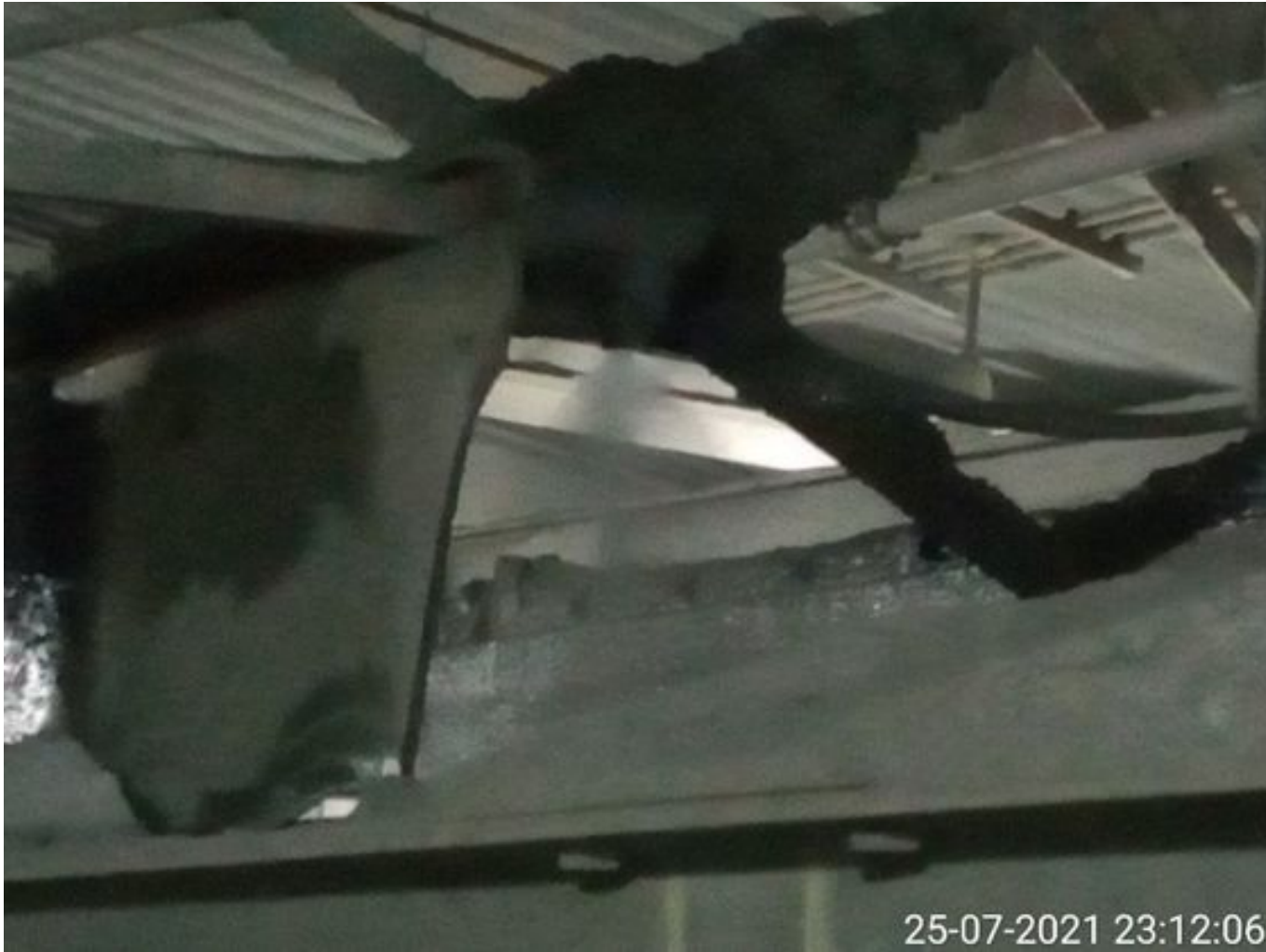
Foto 21: Medida: Regaderas. Lugar: Descarga stock pile planta. Comentarios: Regaderas Descarga Stock Pile planta operativas.