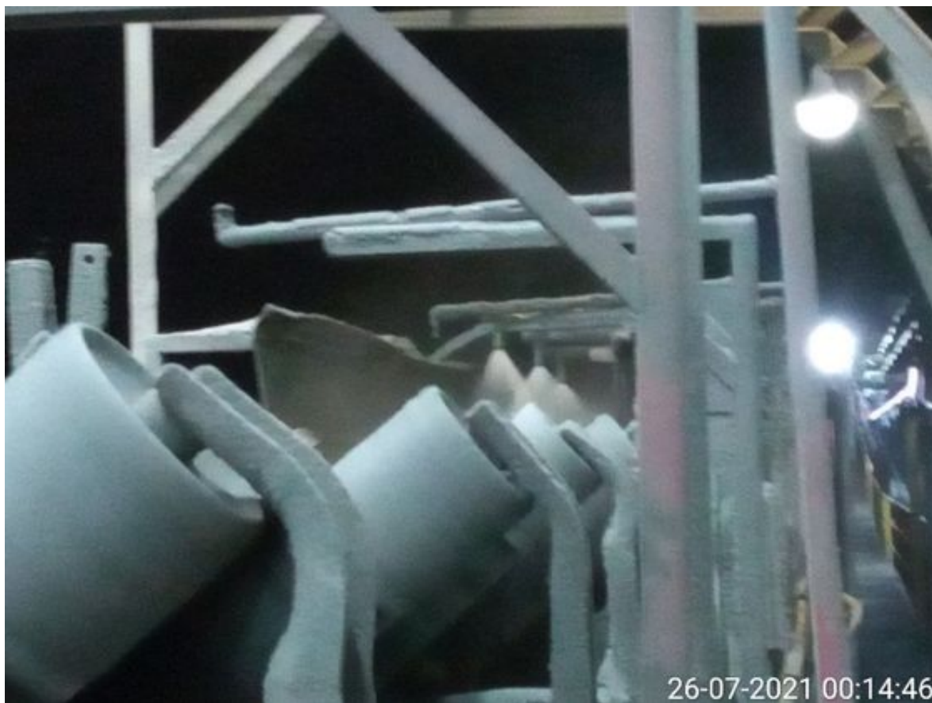
Foto 16: Medida: Regaderas. Lugar: TP2. Comentarios: Regaderas TP2 operativas.