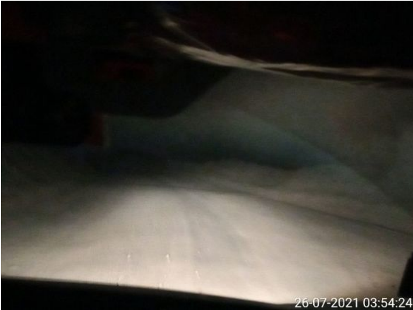
Foto 8: Medida: Riego de caminos EPSA Cerro Amarillo. Lugar: Fases superiores. Comentarios: Sin circuito por colación. 1 EPSA operativo.