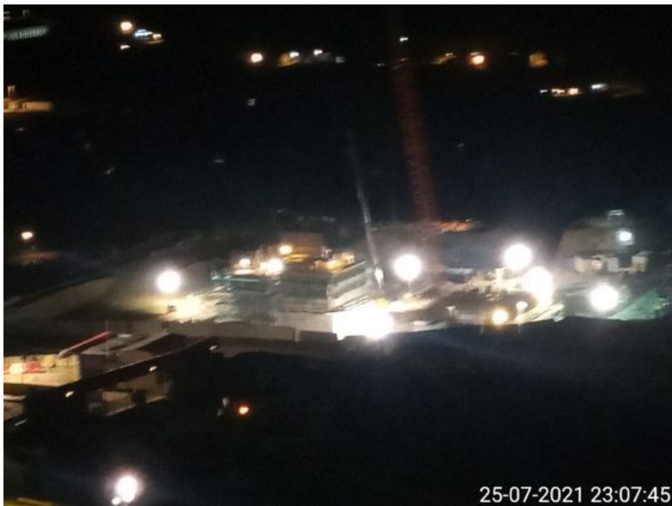
Foto 22: Medida: Riego de frentes de carguio. Lugar: INCO. Comentarios: Sin trabajos en turno noche.