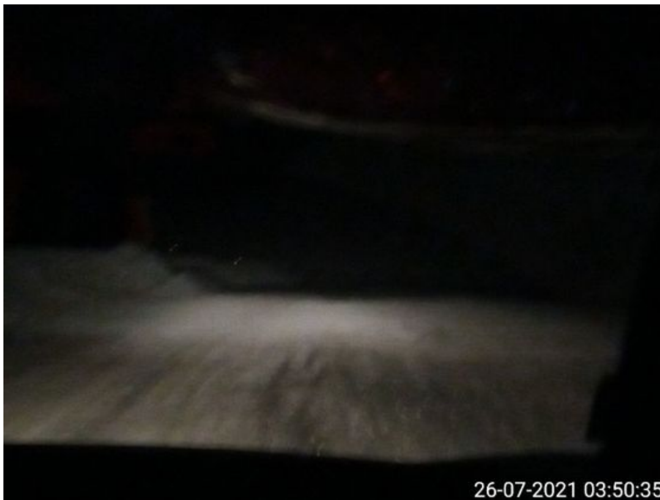
Foto 1: Medida: Riego de caminos. Lugar: Fases Intermedias. Comentarios: Se observan rampas humectadas con riego 2x1. 2 Besalcos operativos. Cachimbas Chancado 1, 2 y 3 operativas.