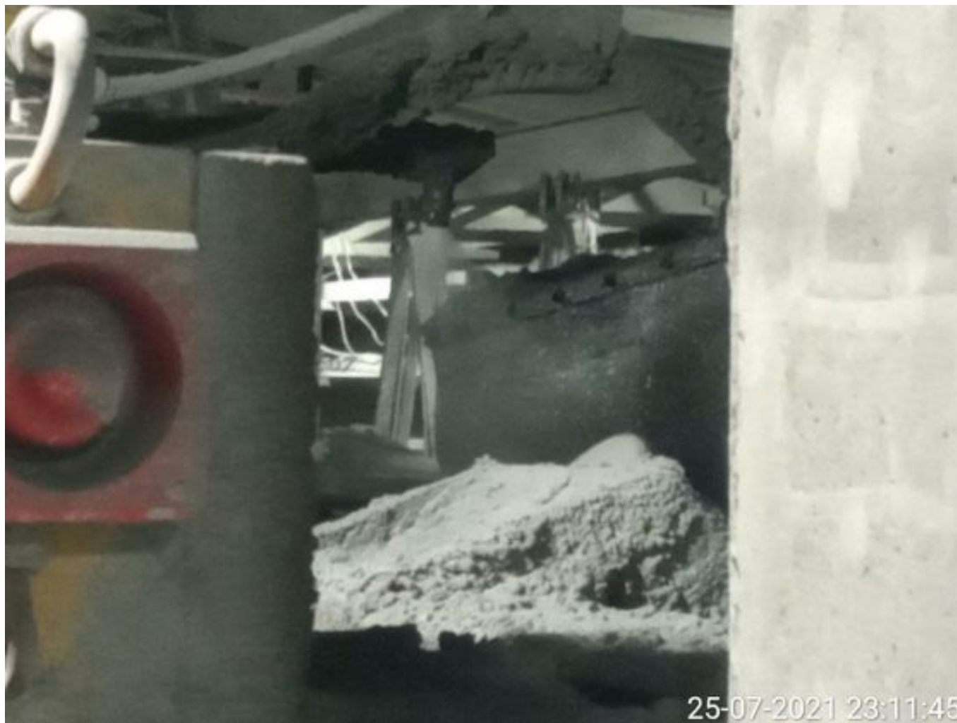
Foto 20: Medida: Regaderas. Lugar: Descarga stock pile planta. Comentarios: Regaderas Descarga Stock Pile planta operativas.