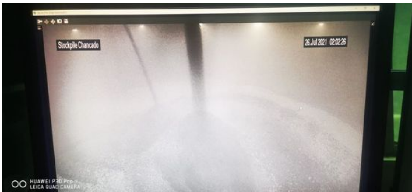
Foto 19: Medida: Espumante en Correas y Stock Pile. Lugar: Chancado 2. Comentarios: Espumante en Correas y Stock Pile Chancado 2 operativo. Stock de producto TK 4.280 litros. Ambas bombas operativas al 20%.