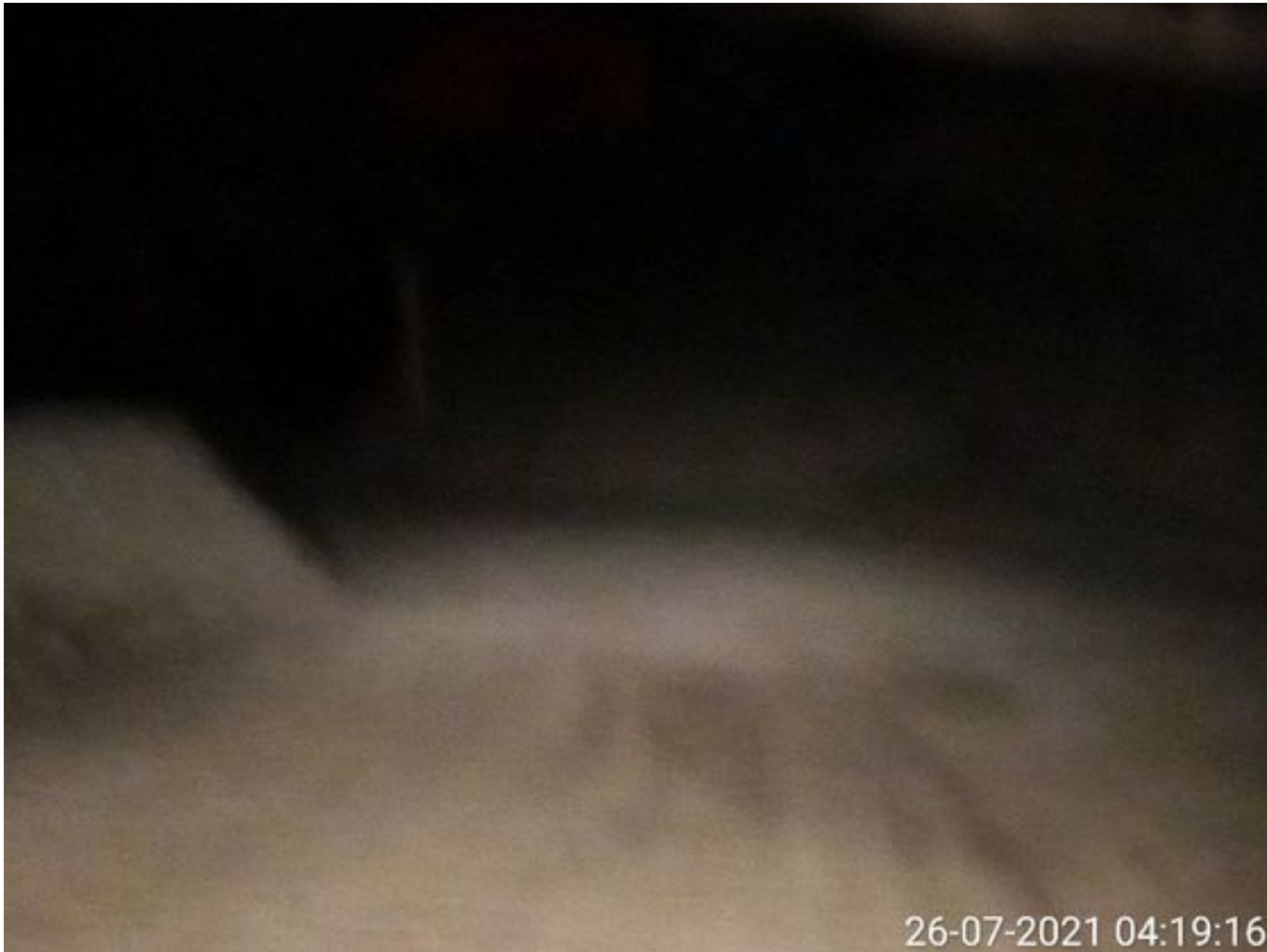
Foto 2: Medida: Riego de caminos. Lugar: Fases Intermedias. Comentarios: Se observan rampas humectadas con riego 2x1. 2 Besalcos operativos. Cachimbas Chancado 1, 2 y 3 operativas.