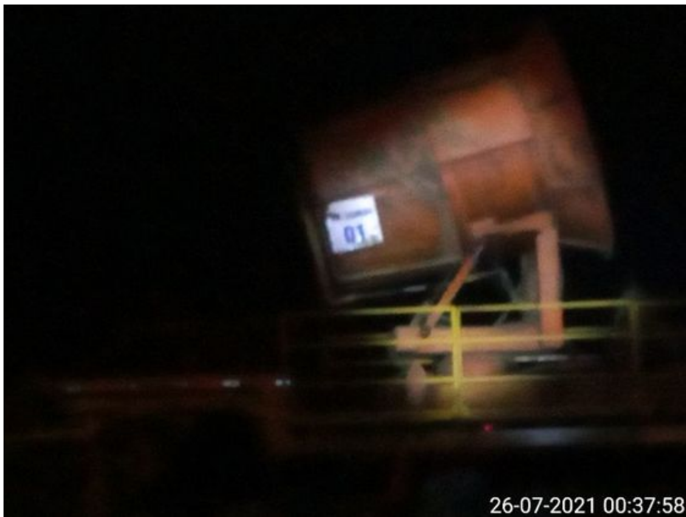
Foto 7: Medida: Fogcannon 1. Lugar: . Comentarios: Fogcannon 1 en reserva.