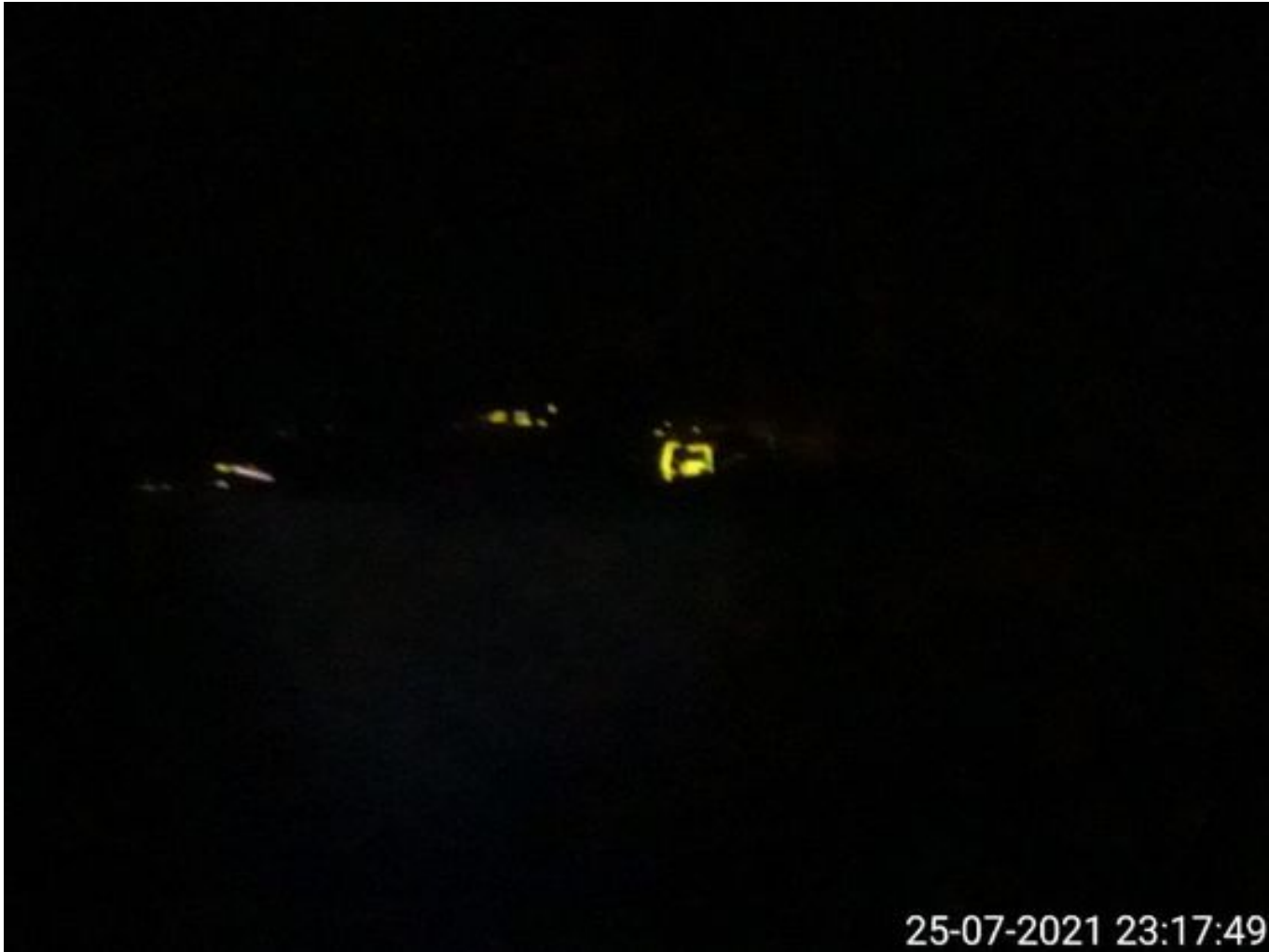
Foto 25: Medida: Fogcanon turno noche. Lugar: Patio 9. Comentarios: Equipo no es requerido.