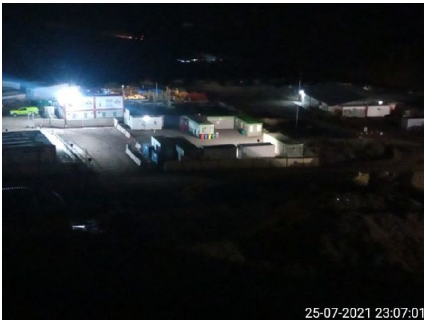
Foto 23: Medida: Aplicacion de producto surpesor en caminos. Lugar: INCO. Comentarios: Sin trabajos en turno noche.