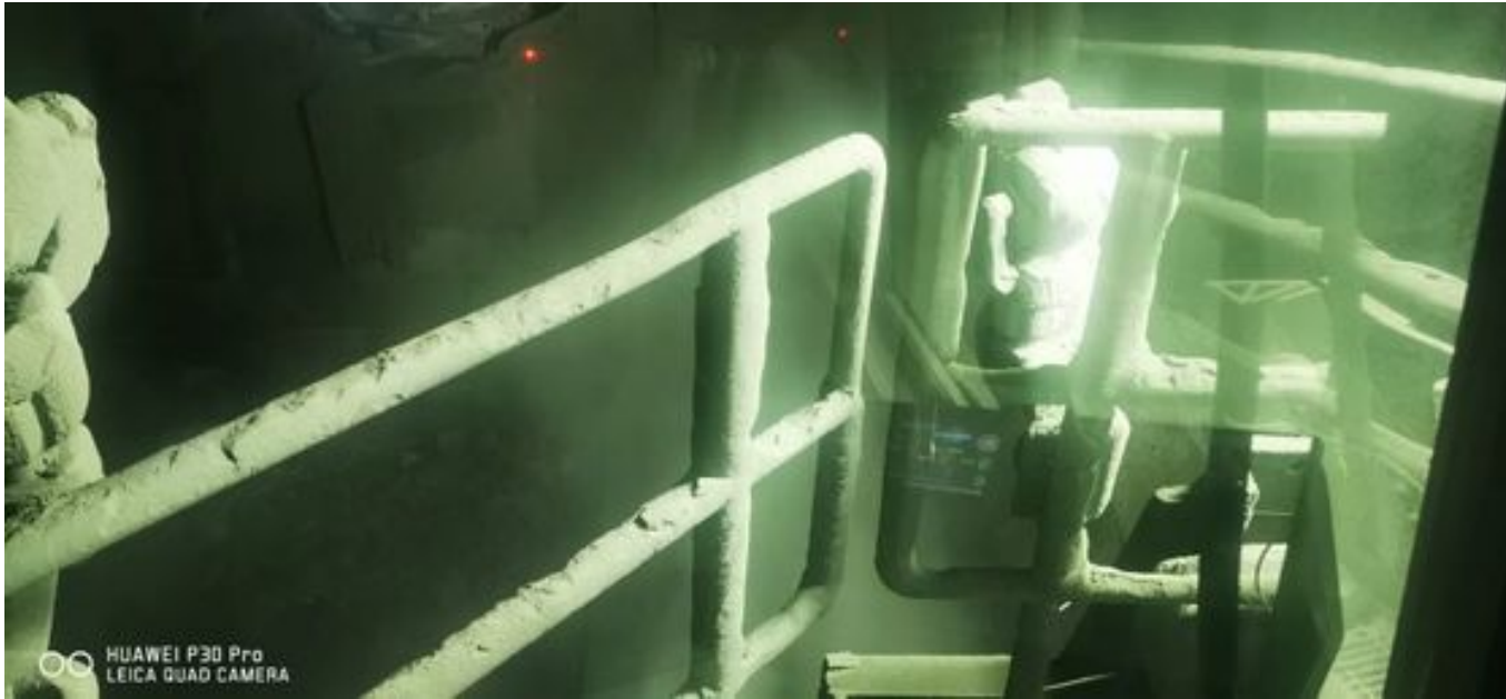
Foto 14: Medida: Supresor de polvo. Lugar: Taza Chancado 1. Comentarios: Supresor de polvo Chancado 1 operativo. Se observa material particulado en suspensión. Medida de mitigación no es suficiente.