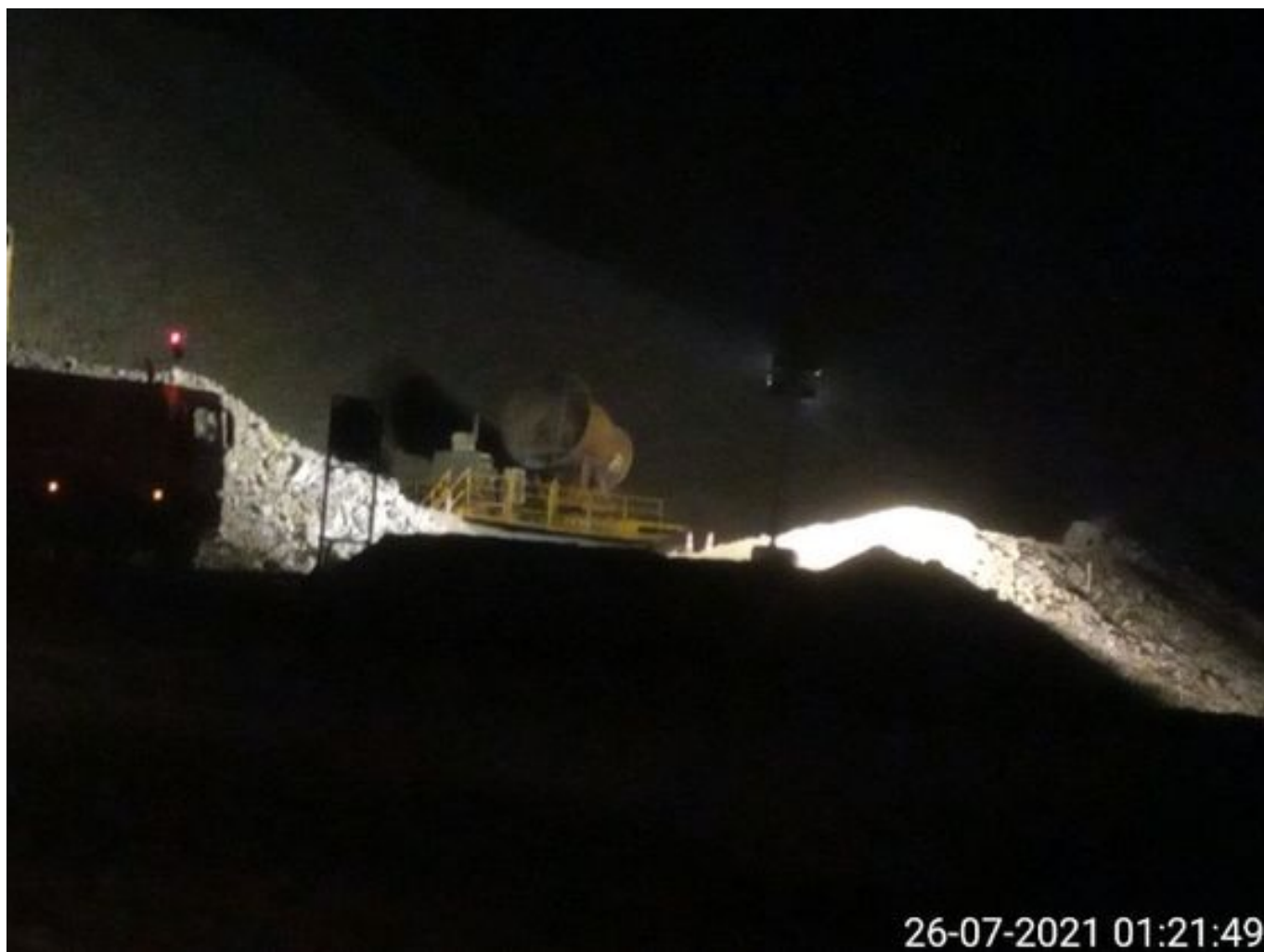
Foto 10: Medida: Fogcannon 2. Lugar: . Comentarios: Fogcannon 2 en reserva.