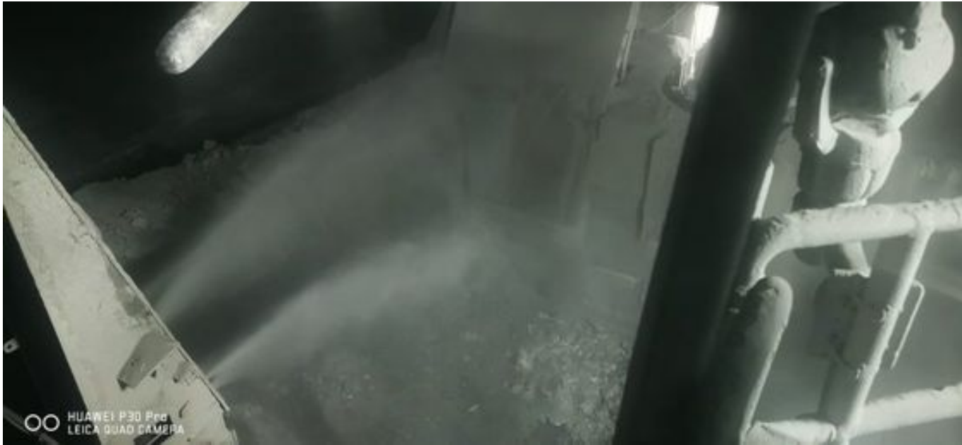
Foto 15: Medida: Supresor de polvo. Lugar: Taza Chancado 1. Comentarios: Supresor de polvo Chancado 1 operativo. Se observa material particulado en suspensión. Medida de mitigación no es suficiente.