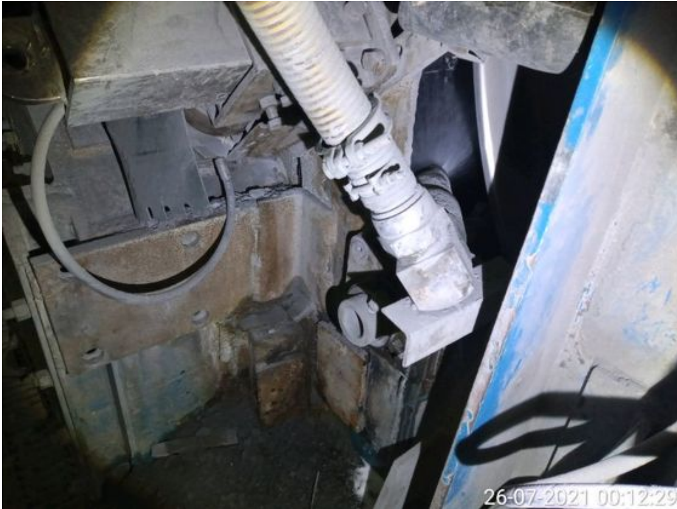
Foto 11: Medida: Aplicación Espuma Surfactante. Lugar: Correa CV 007. Comentarios: Aplicación Espuma Surfactante Correa CV007 operativa.