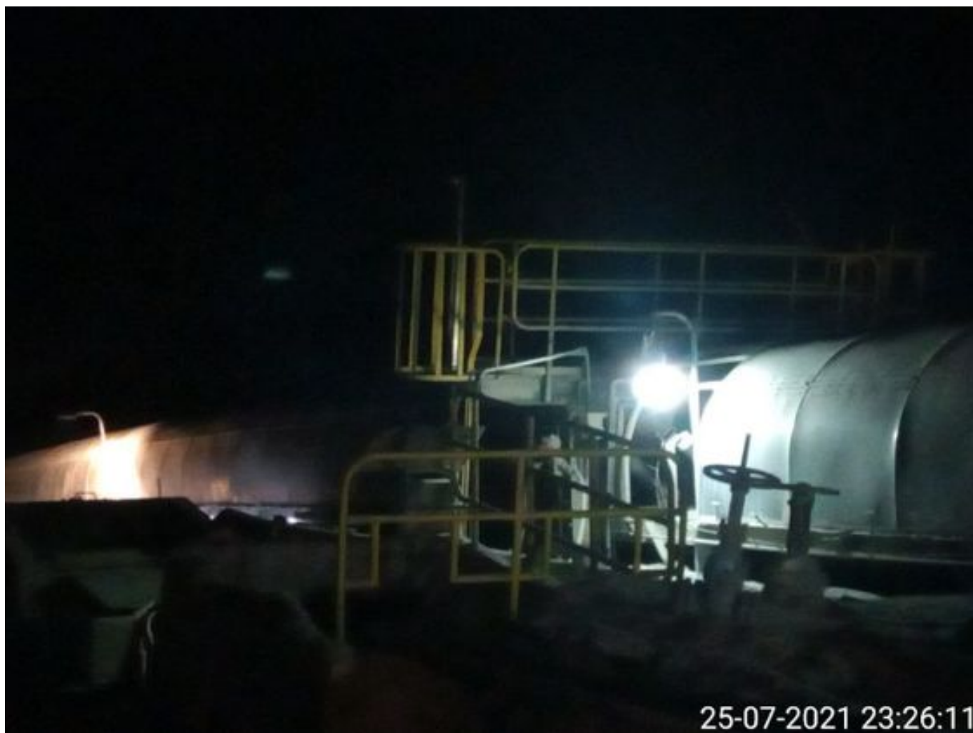
Foto 12: Medida: Regaderas en Correa Transportadora. Lugar: Salida túnel 3. Comentarios: Regaderas en Correa Transportadora Salida Túnel 3 operativas.