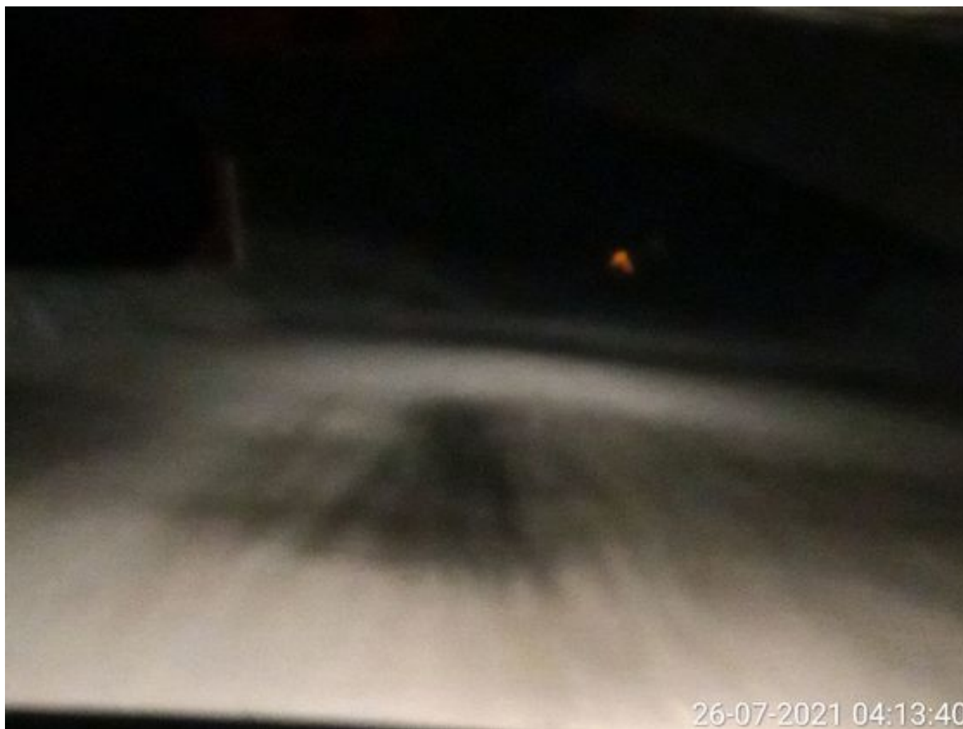
Foto 5: Medida: Riego de caminos. Lugar: Fases superiores. Comentarios: Se observan rampas humectadas con riego 2x1. 3 Besalcos operativos. Cachimbas Hito y Norte Norte operativas.