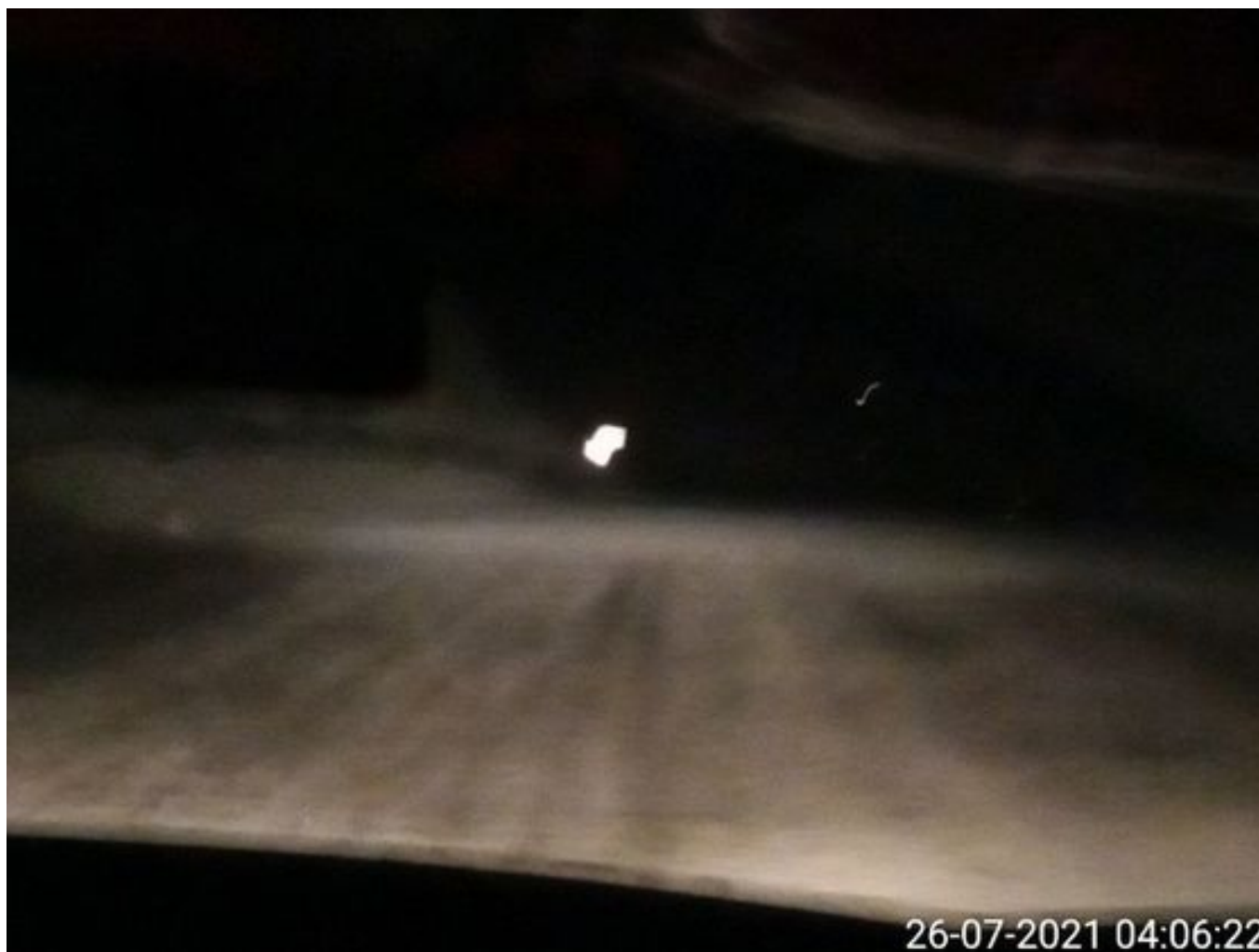
Foto 6: Medida: Riego de caminos. Lugar: Fases superiores. Comentarios: Se observan rampas humectadas con riego 2x1. 3 Besalcos operativos. Cachimbas Hito y Norte Norte operativas.