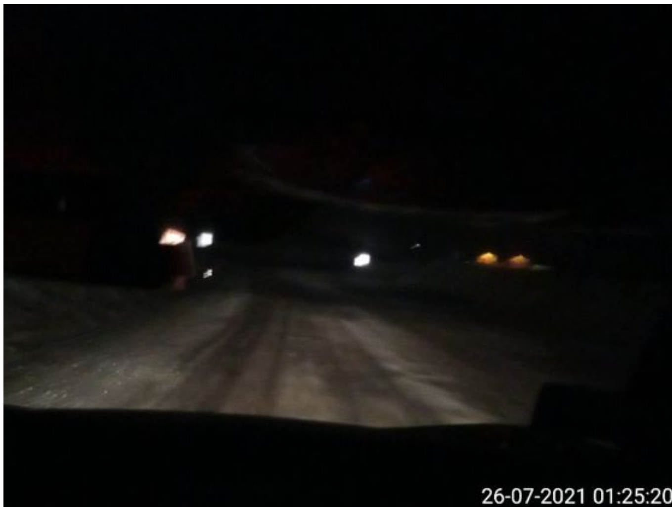
Foto 4: Medida: Riego de caminos. Lugar: Fases Inferiores. Comentarios: Se observan rampas con producto aplicado. 2 DAS operativos (841 y 843).