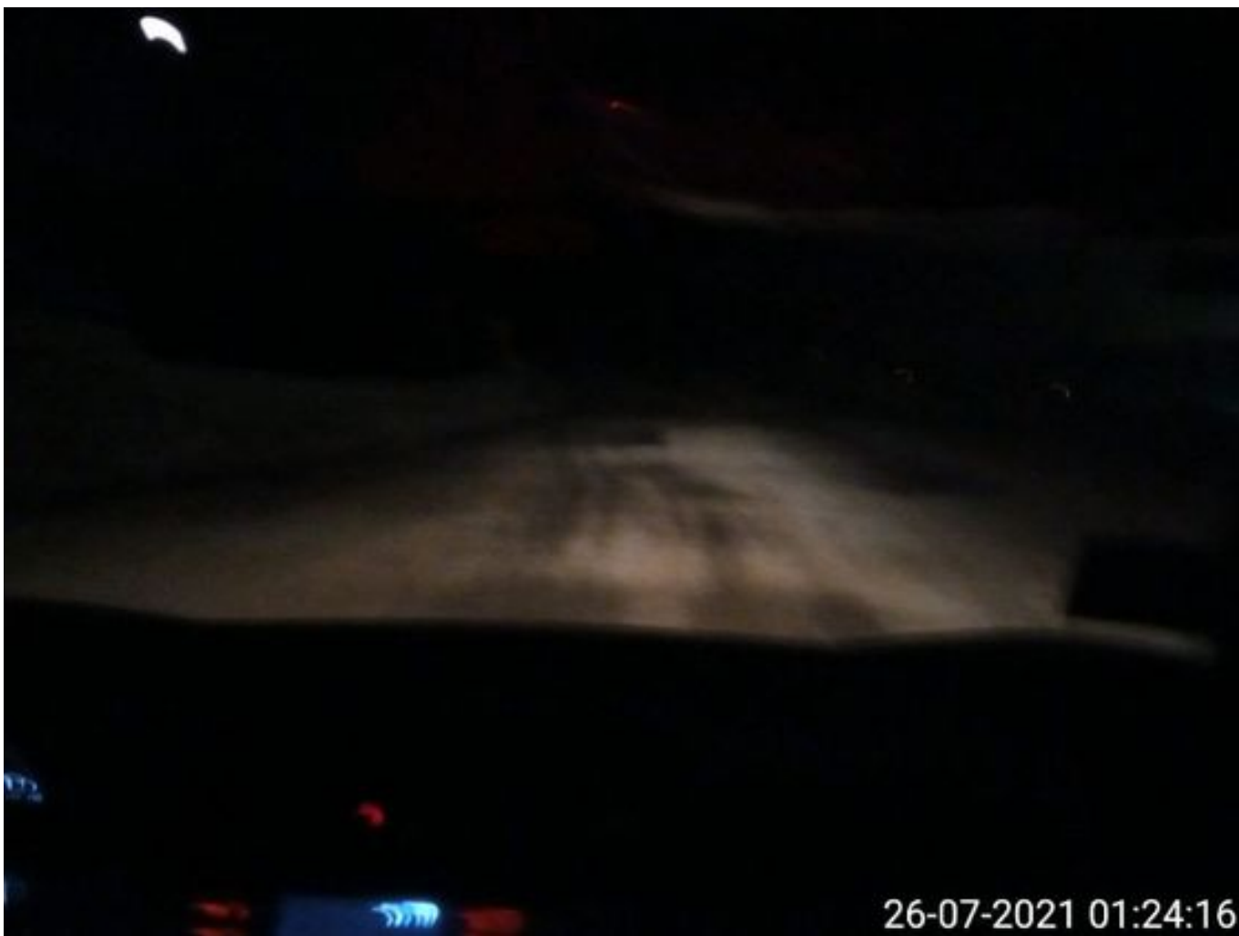
Foto 3: Medida: Riego de caminos. Lugar: Fases Inferiores. Comentarios: Se observan rampas con producto aplicado. 2 DAS operativos (841 y 843).