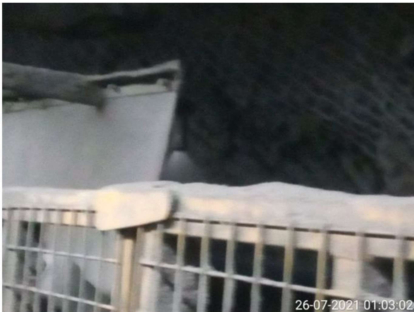
Foto 18: Medida: Regaderas. Lugar: TP1. Comentarios: Regaderas TP1 operativas.